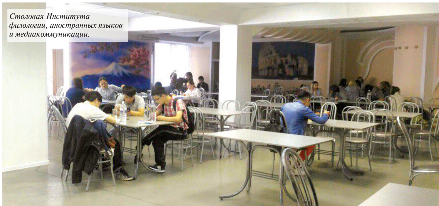
Столовая Института филологии, иностранных языков и медиакоммуникации.

Теперь самое важное – на что, собственно, потратить эти 100 (возможно, чуть больше) рублей. Ассортимент во всех столовых разный. Процесс покупки еды начинается с выбора закуски, в качестве которой в основном выступает салат. И здесь можно встретить как привычные всем огурцы с помидорами и салат