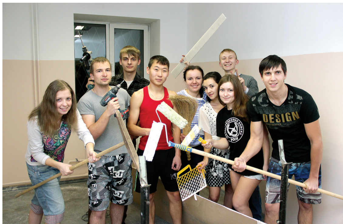
Подготовка к конкурсу на звание лучшего студенческого общежития города Иркутска.

На правом берегу Ангары также расположены общежития №№ 5 и 6, в которых проживают геологи, юристы, историки, студенты ИМЭИ, БПФ, ФСР, Института социальных наук (ИСН). В общежитии № 6 есть этаж для семейных студентов,