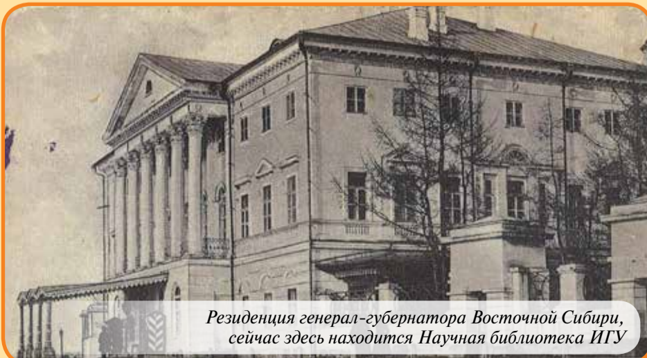
Резиденция генерал-губернатора Восточной Сибири, сейчас здесь находится Научная библиотека ИГУ

Институт филологии, иностранных языков и медиакоммуникации