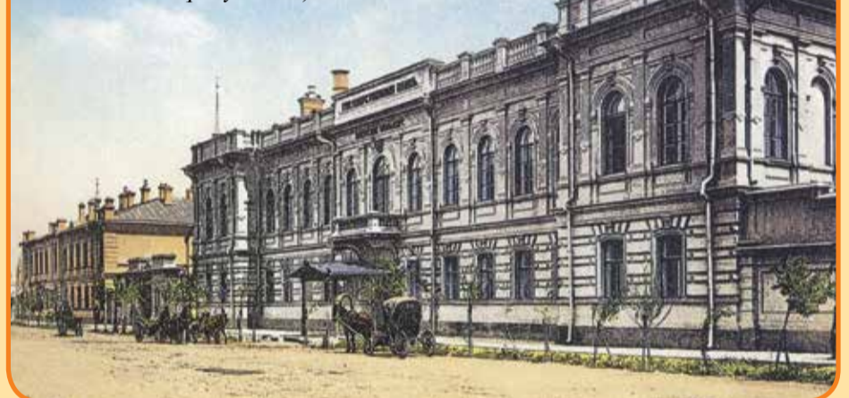
Государственный банк, сейчас в этом здании размещается Институт социальных наук, геологический факультет, НИИ биологии

Международная кафедра водных ресурсов ЮНЕСКО