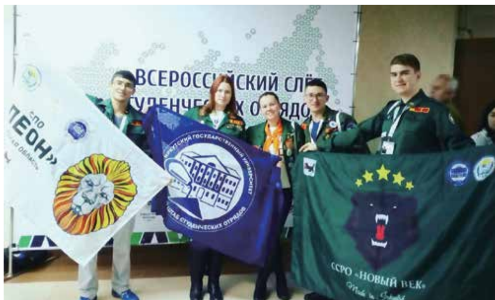
На всероссийском слете, 2016 год

СПО «Леон» , самый молодой из студенческих педагогических отрядов ИГУ, живущий и работающий под девизом «Кто, если не мы, когда, если не сейчас!». Основан в 2014 году, базируется на факультете психологии. Отряд занял одно из достойных мест в рядах СПО ИГУ. Бойцы отряда активно участвуют во многих университетских мероприятиях, а также в мероприятиях министерств Иркутской области. Принимают участие во многих всероссийских и областных проектах, таких как Снежный десант, День Российских студенческих отрядов, различных социальных акциях. Вместе с этим, молодые вожатые работают в лагерях Иркутской области.