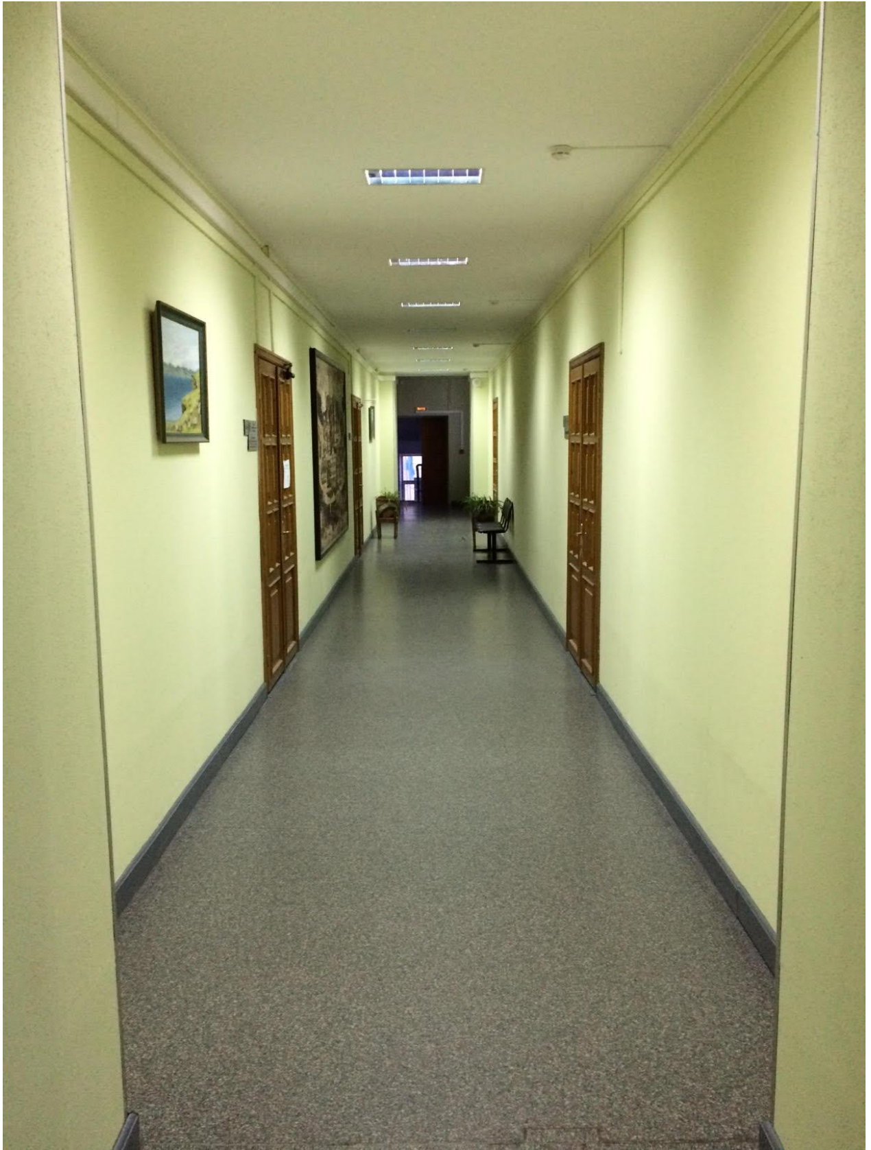
Административный корпус №2, ул. Карла Маркса, 1 (ремонт коридоров 2, 3 этажей)