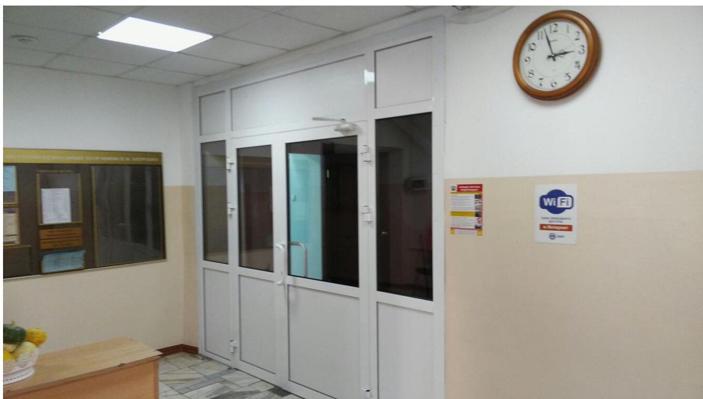
Учебный корпус №5, ул. Чкалова, 2 (установка дверей из алюминиевого профиля)