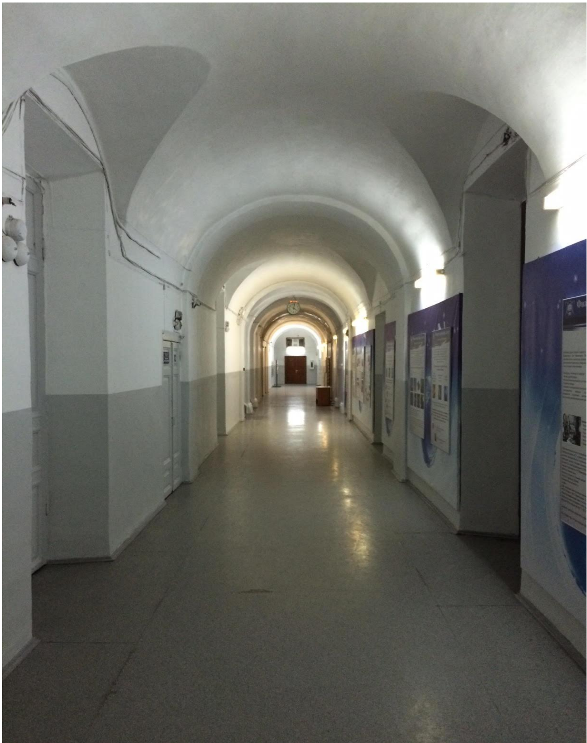
Учебный корпус №1, б. Гагарина, 20 (ремонт коридоров 2, 3 этажей, центральной лестницы)