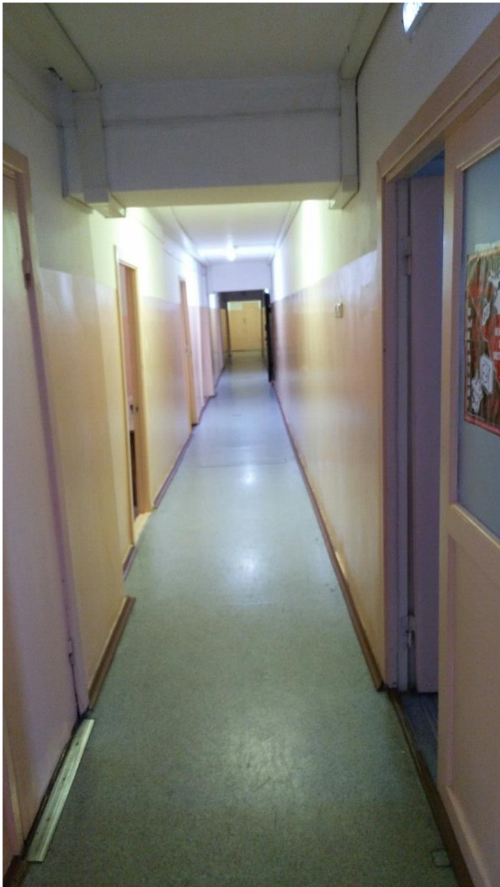
Общежитие №9, ул. Улан-Баторская, 8 (Ремонт коридора и холла)