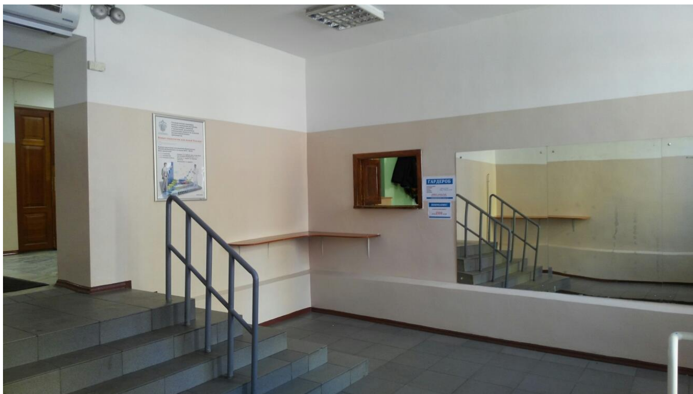
Учебный корпус №5, ул. Чкалова, 2 (ремонт холла)