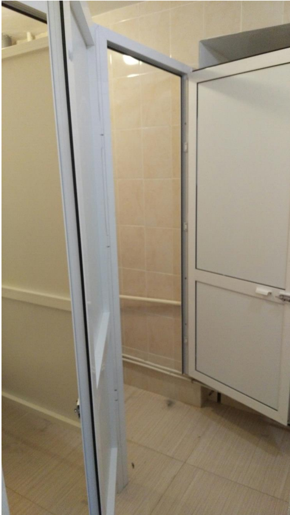
Общезитие №3, ул. Улан-Баторская, 6 (установка сантехкабинок в отремонти- ванных жилых секциях)