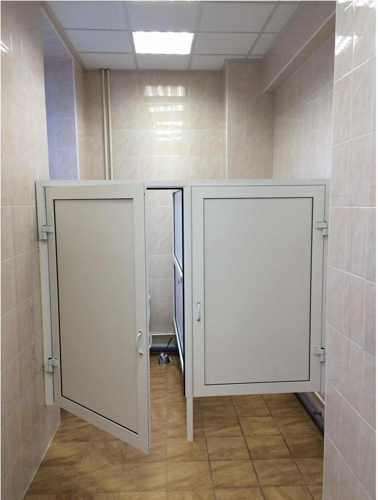
Административный корпус №3, ул. К. Маркса, 1 (ремонт мужских и женских туалетов)