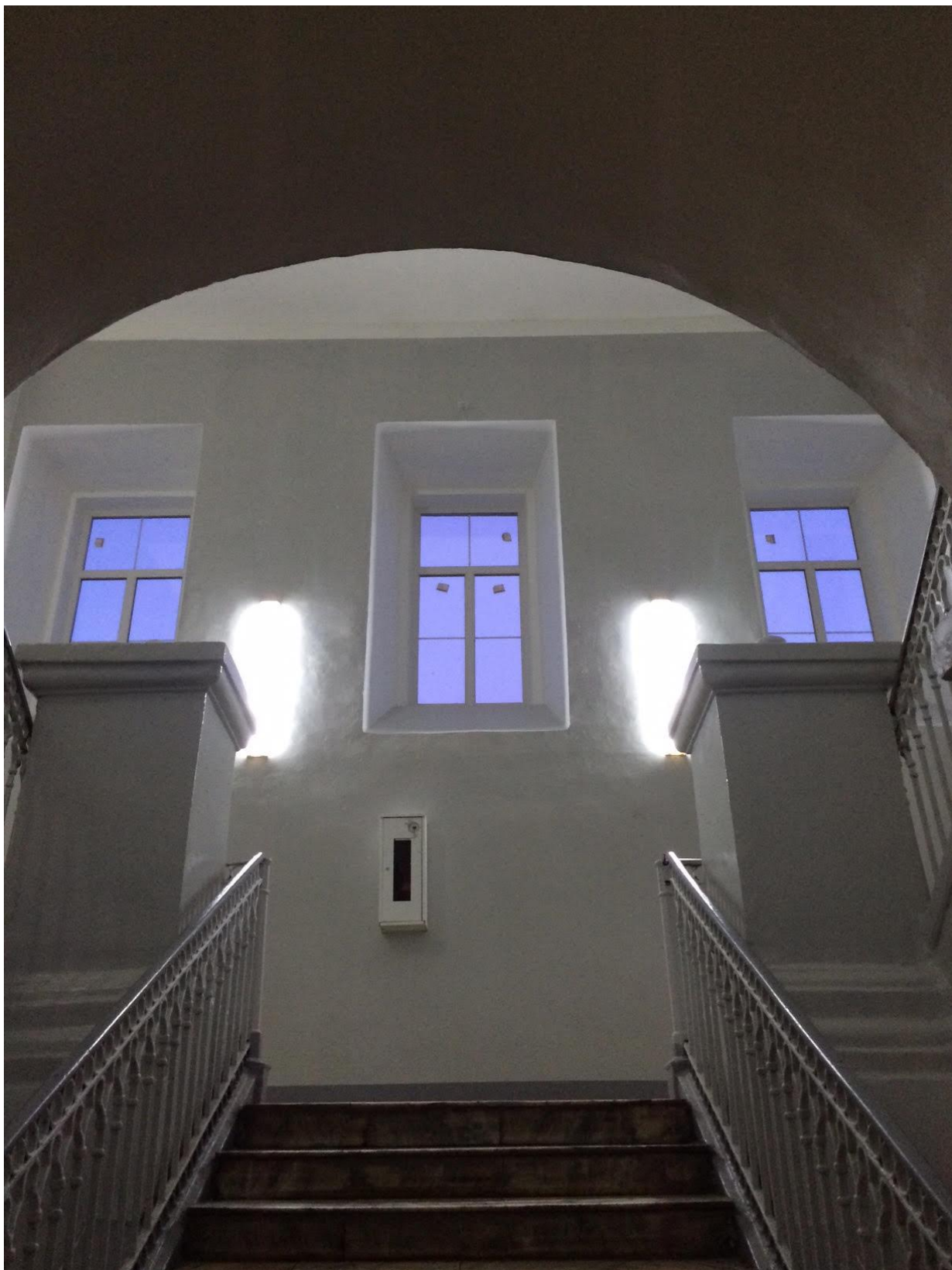
Учебный корпус №1, б. Гагарина, 20 (ремонт центральной лестницы и замена деревянных оконных блоков на окна ПВХ)