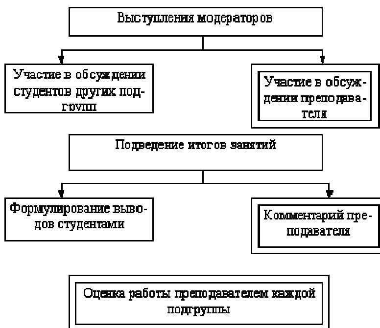
Рис. 3. Завершающая стадия работы над кейсом