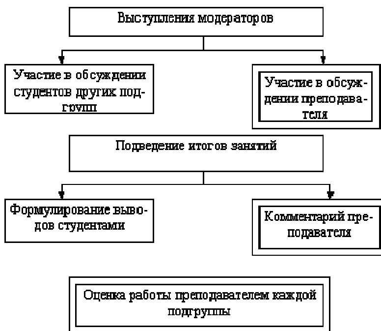
Рис. 3. Завершающая стадия работы над кейсом