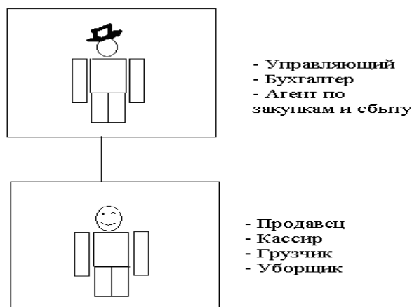
Рис. Организационная структура

сбыту. Ваш подчиненный совмещает функции продавца, кассира, грузчика и уборщика. Ваши деловые отношения можно изобразить в виде схемы (см. рис.).