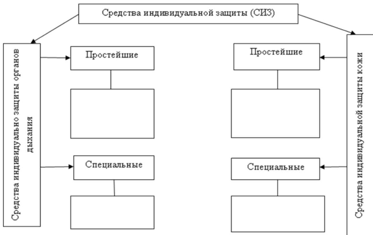
Рисунок (1) Схема средств индивидуальной защиты

В) Используя учебную литературу, запишите, что такое средства коллективной защиты (СКЗ) - _____