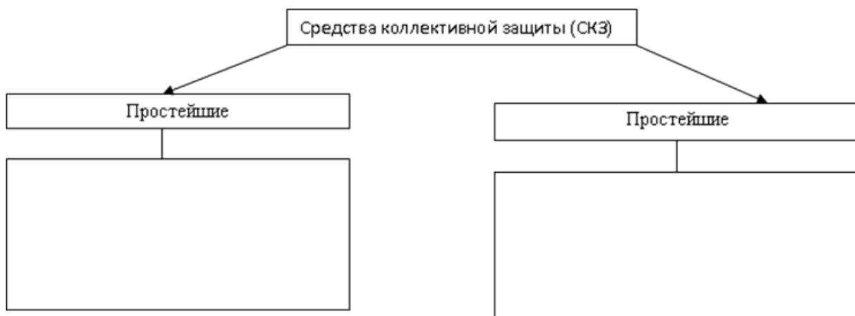
Рисунок(2) Средства коллективной защиты (СКЗ)

Г) Заполните схему «Средства коллективной защиты» (СКЗ), опишите, что к ним относится.