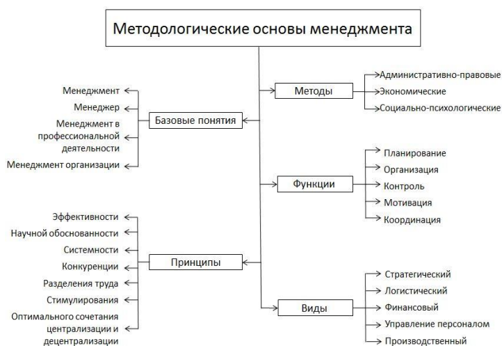
Рис. Примеры схем представления методологических основ по конкретной предметной области