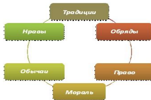
Схемы 40. Виды поведенческих норм

Задание 4. «Расшифруйте» предлагаемую ниже схему «Виды поведенческих норм»: