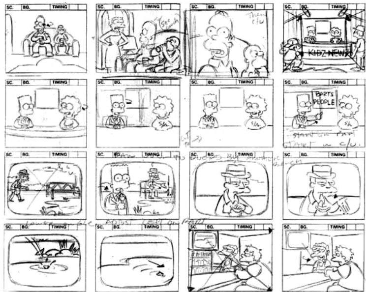
Рис.2 Черно-белый пример раскадровки мультфильма