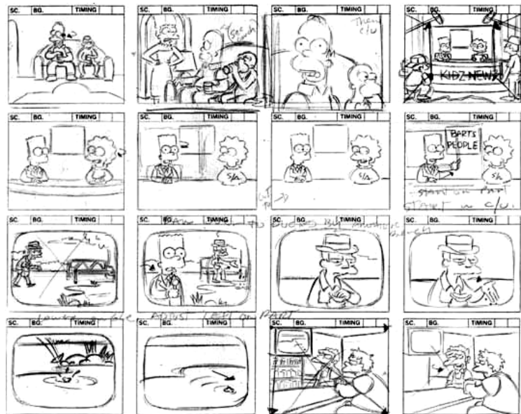
Рис.2 Черно-белый пример раскадровки мультфильма