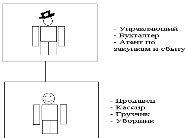
Рис. Организационная структура

Представьте себе, что вы – владелец небольшого магазина, где кроме вас работает всего один человек. Вы одновременно и управляющий, и бухгалтер, и агент по закупкам и сбыту. Ваш подчиненный совмещает функции продавца, кассира, грузчика и уборщика. Ваши деловые отношения можно изобразить в виде схемы (см. рис.).