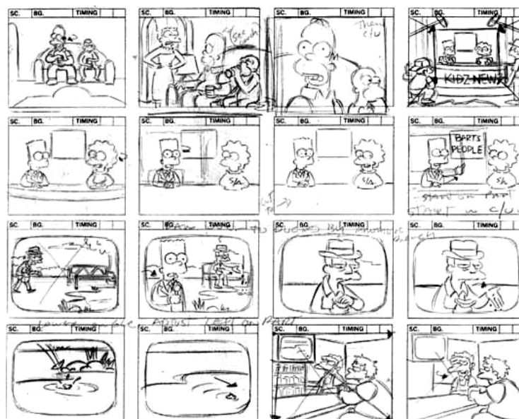
Рис.2 Черно-белый пример раскадровки мультфильма