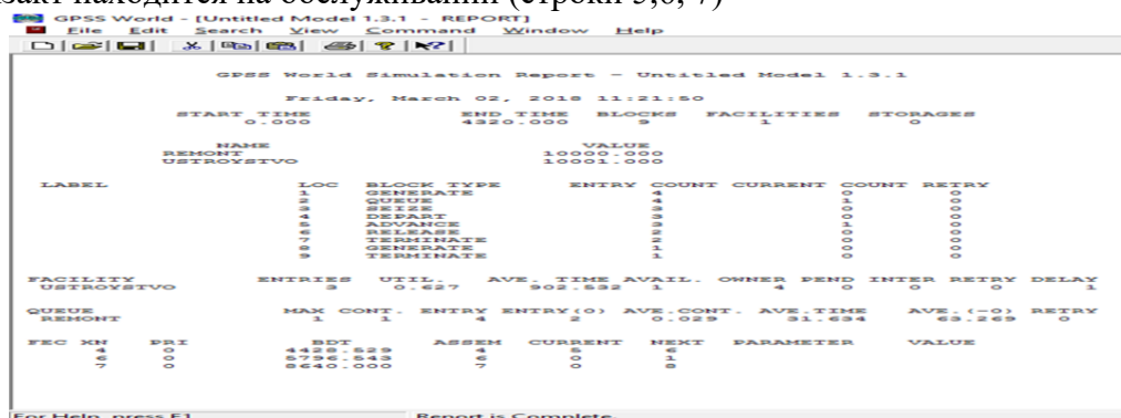
Рис 6. Отчет к задаче 1