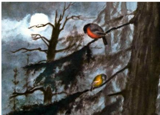
Конашевич В.М. сонный лес