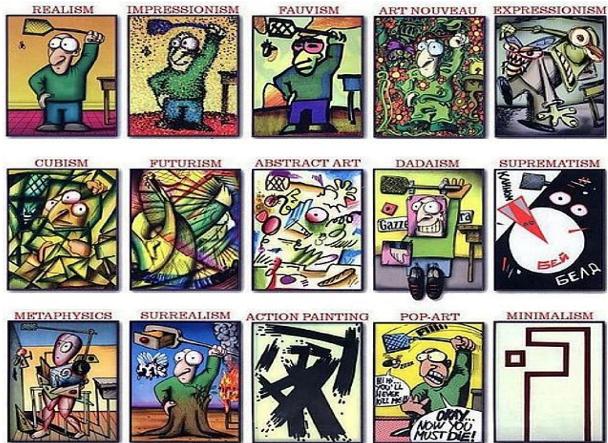
4.4.4. Таблица «Сенсорное развитие детей от 2х до 7 лет»