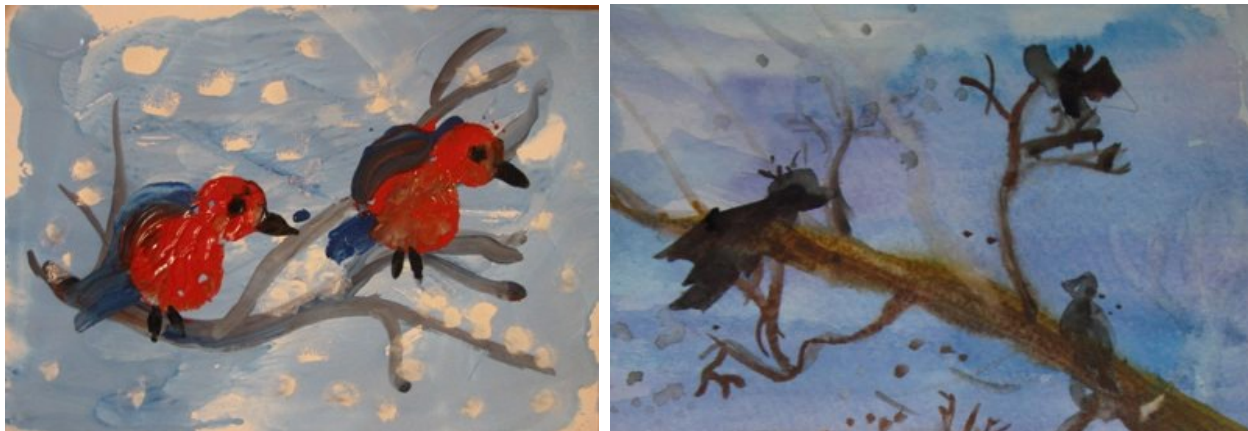
Критерии оценки заданий