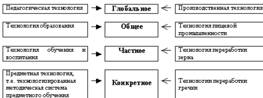
Рис. 1. Соотношение технологических понятий

В рамках установления теоретико-методологических основ педагогической технологии необходимо, на наш взгляд, развести термины «педагогическая технология», «технология образования», «технология обучения», «технологизация предметного обучения». Данные понятия генетически связаны между собой по линии отношений: глобальное - общее - частное - конкретное, где глобальное - это педагогическая технология, общее - технология образования, частное - технология обучения, конкретное - технологизация процесса обучения и воспитания в рамках конкретного предметного обучения (см. рис. 1).